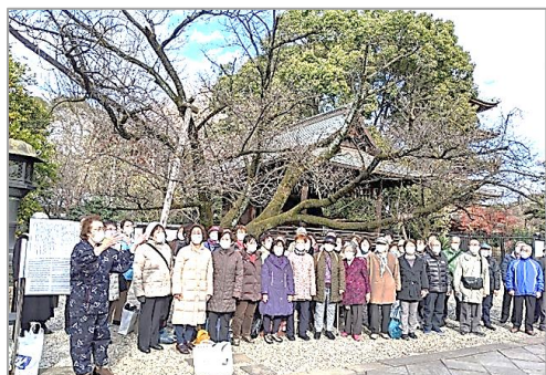
1/25付うたごえ新聞より、合唱団「この灯」 内容の詳細はお読み下さい。

「ひとりで家の中にこもっていると、体調が優れず気持ちが沈んでいたけれど、久しぶりに顔を合わせて歌ったり、しゃべったりして、とっても楽しく、元気になれた」...『うたごえは生きる力』を改めて確かめ合うことができています。