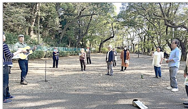
昨年10月31日 多摩川台公園