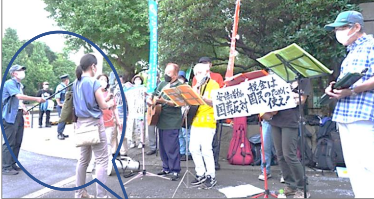
内モンゴルのメディア

(^^♪「国葬ヤメロ！」9/27日国会前には、東京のうたごえ行動に20名を超える仲間が集まりました。